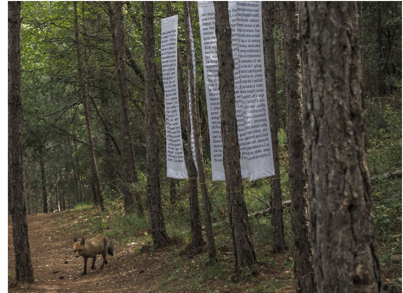
(‘Canto jo i la muntanya balla’ Plana 101. Anagrama, 2019).

L’obra d’Íria Rodon, curiosament ha construït un espai escrit, ha creat un lloc dins la natura, un indret.