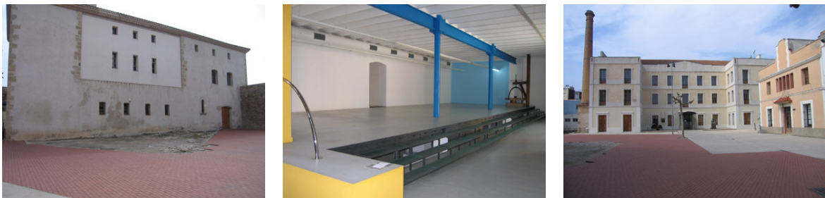
Vista de l'edifici contigu a la Biblioteca: l'Escola d'Art ( ESARDI), interior Biblioteca i de la plaça del Castell.

El festival es realitza en el complex que formen l'Escola d'Art (Esardi), la Biblioteca Pública i la Plaça del Castell.